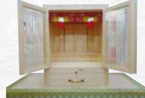
小型 主用材:翌松材