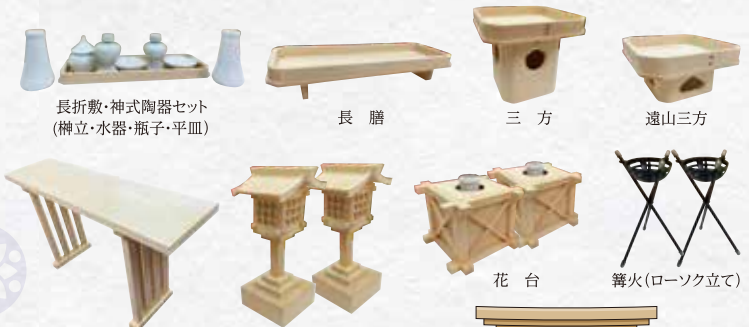
長折敷・神式陶器セット (榊立・水器・瓶子・平皿)