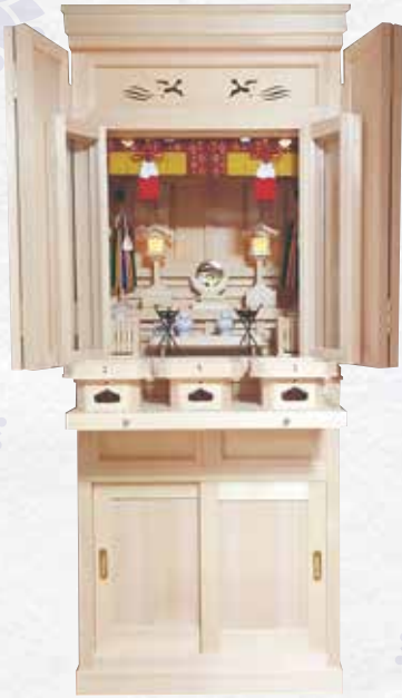
① MS-II 型 主用材:木曽松

厳選された木曽松材を用いて、職人がひと品ひと品、丁寧に作り上げた品だけをお届け致します。重厚かつ荘厳さを調和させた極上の祭壇宮です。