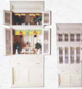
② KM-II 型 主用材:木曽松

〈上段〉神棚 〈下段〉御霊舎を備えた一体型です。 参考寸法:(巾)80×(高さ)195×(奥行)60cm ※各寸法のご変更はご相談ください。