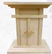
⑤ OT 型 主用材:木曽松

参考寸法:(巾)60×(高さ)150×(奥行)55cm ※各寸法のご変更はご相談ください。