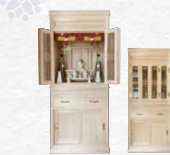
③ MS-III 型 主用材:木曽松

参考寸法:(巾)62×(高さ)75×(奥行)50cm ※各寸法のご変更はご相談ください。