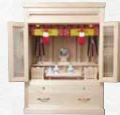
④ SM 型 主用材:木曽松

〈上段〉神棚 〈下段〉御霊舎を備えた一体型です。 参考寸法:(巾)80×(高さ)195×(奥行)60cm ※各寸法のご変更はご相談ください。