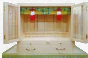
大型 主用材:翌松材